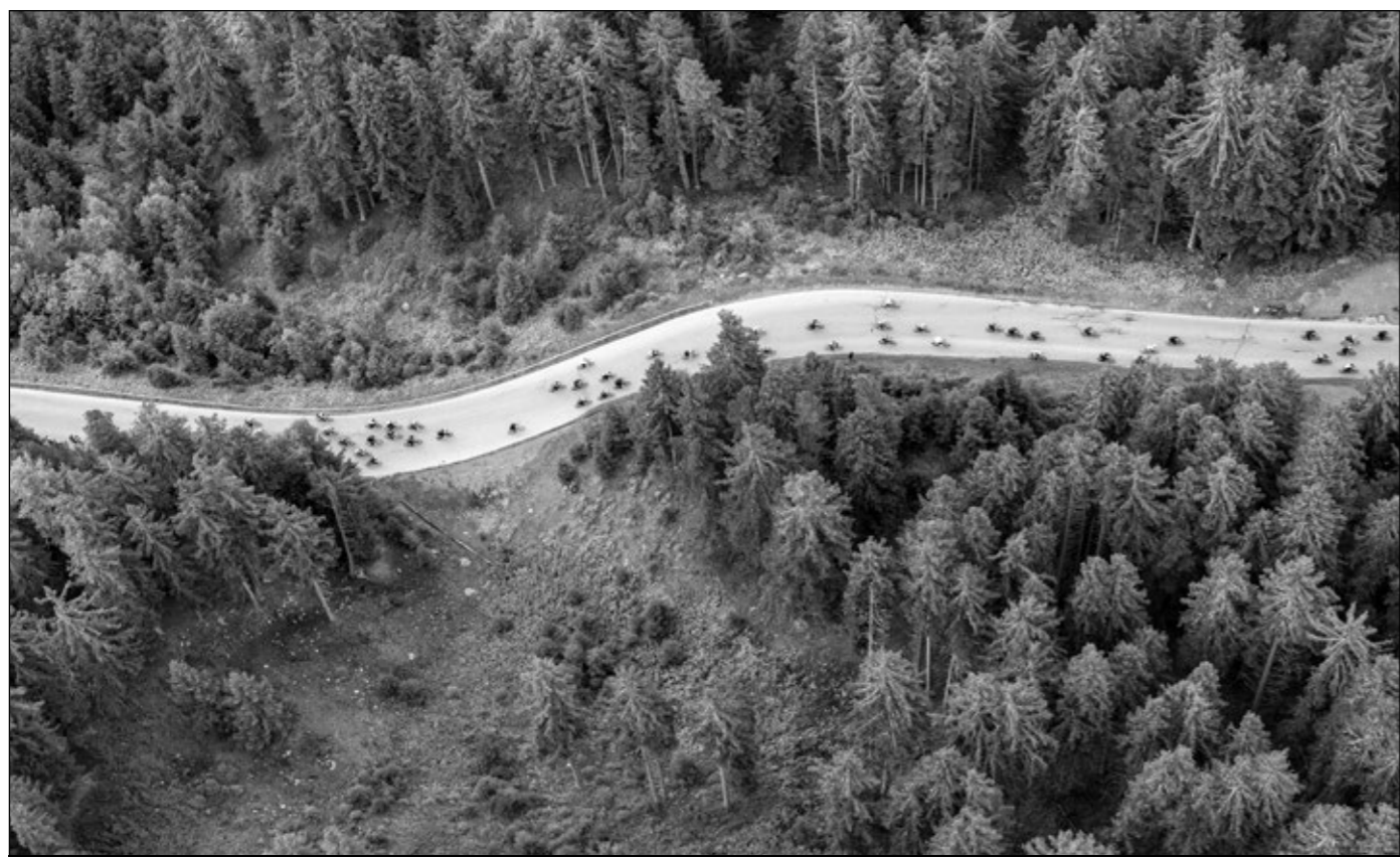
2.751 Teilnehmer:innen gingen um 06:30 Uhr in Sölden an den Start.