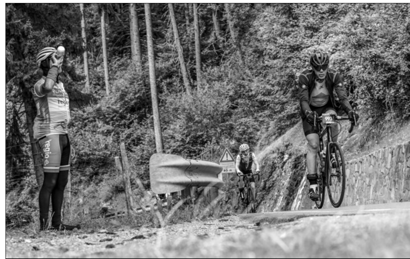
Kurz mal eine Trinkpause einlegen, soviel Zeit muss selbst beim Ötztaler Radmarathon sein.