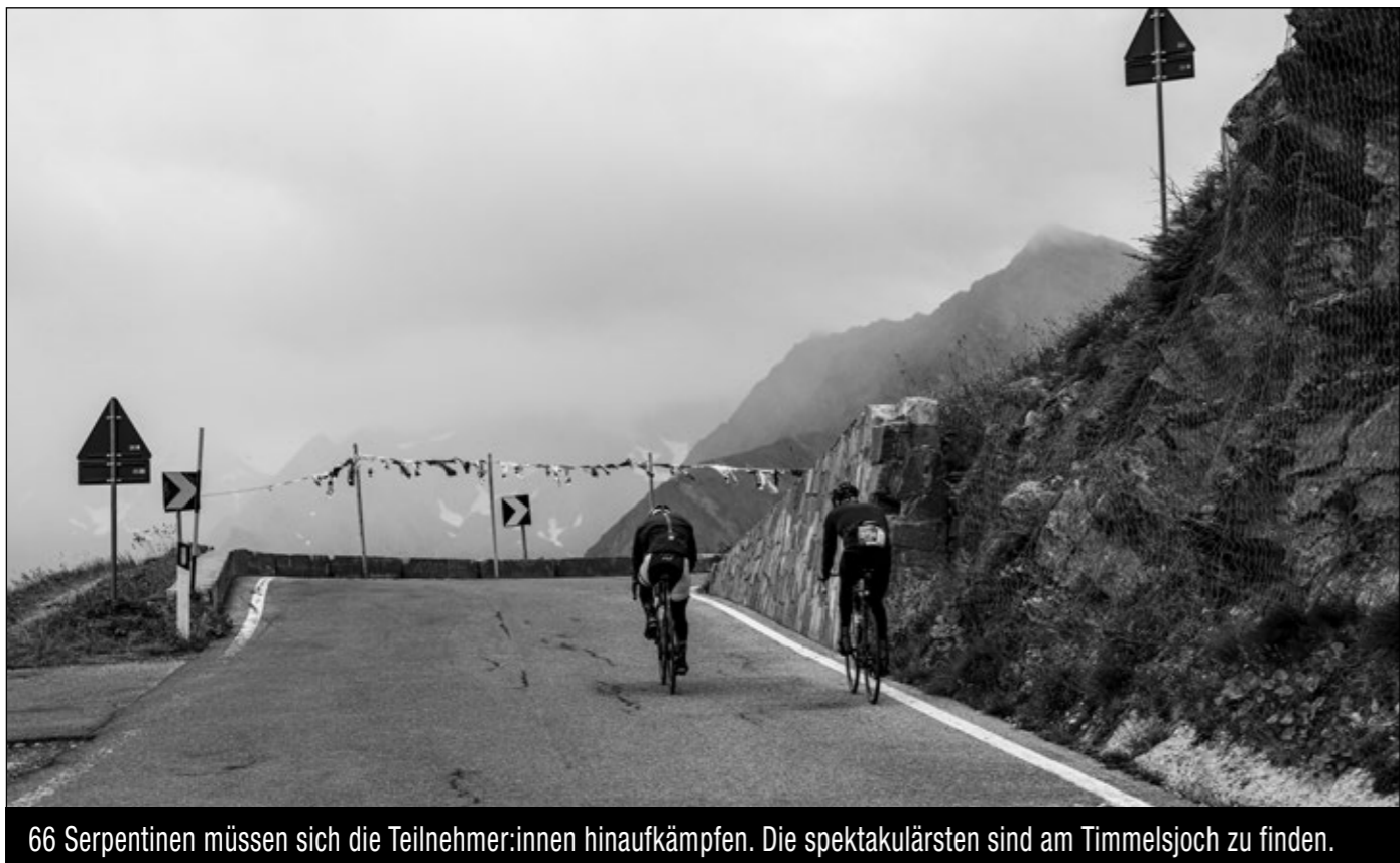
66 Serpentinien müssen sich die Teilnehmer:innen hinaufkämpfen. Die spektakulärsten sind am Timmelsjoch zu finden.