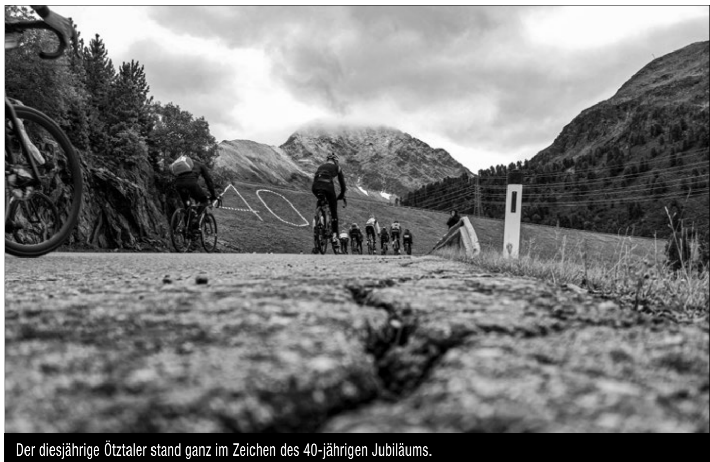
Der diesjährige Ötztaler stand ganz im Zeichen des 40-jährigen Jubiläums.