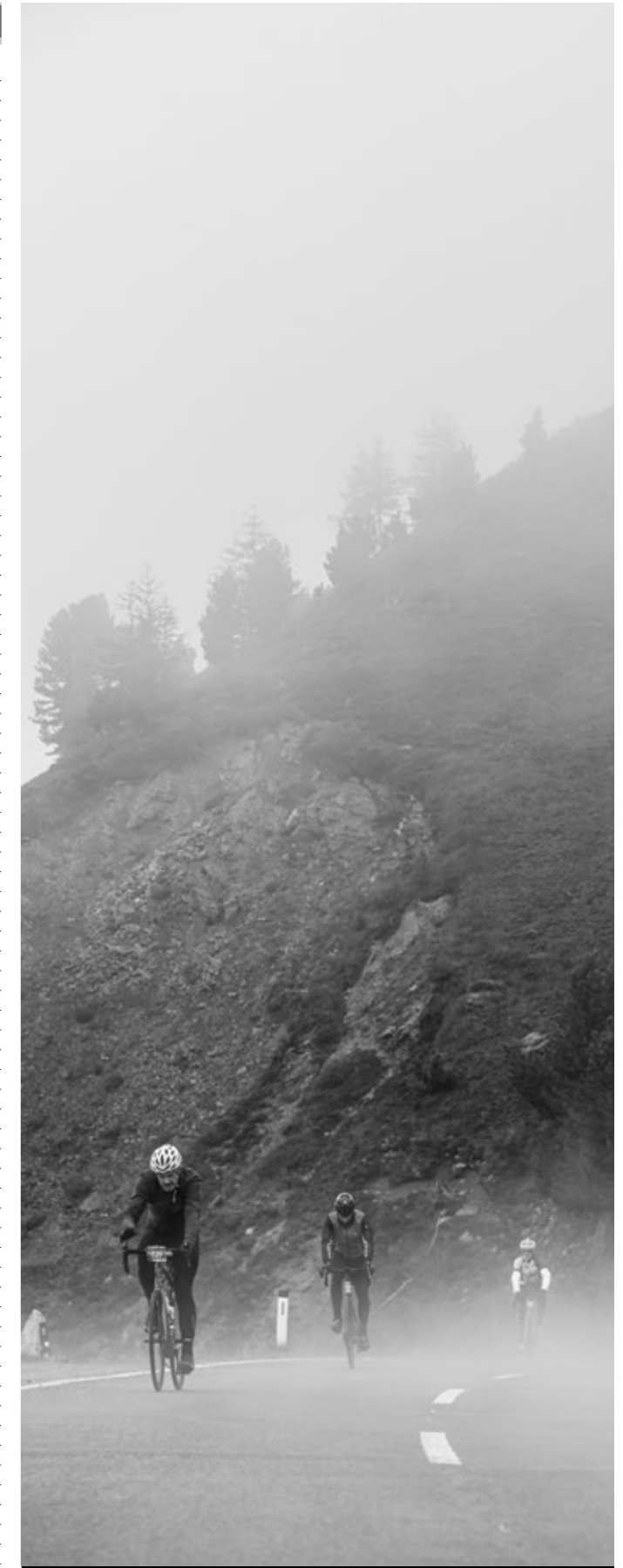
Das Wetter wurde dem Mythos Öztaler gerecht.