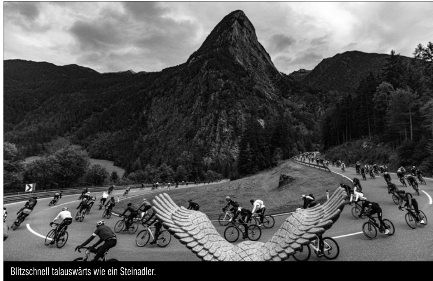
Blitzschnell talauswärts wie ein Steinadler.